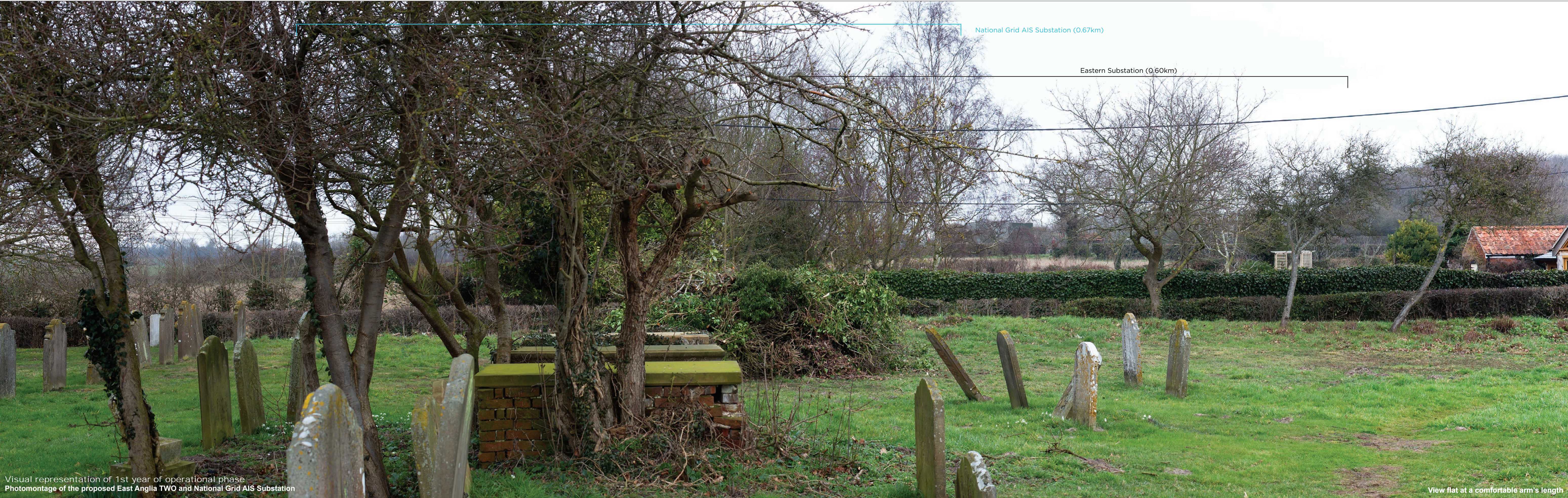
Visual representation of 1st year of operational phase Photomontage of the proposed East Anglia TWO and National Grid AIS Substation