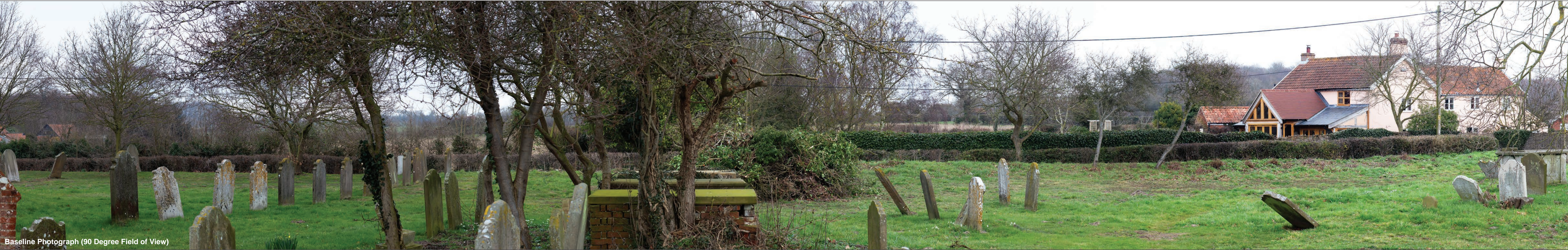
Baseline Photograph (90 Degree Field of View)